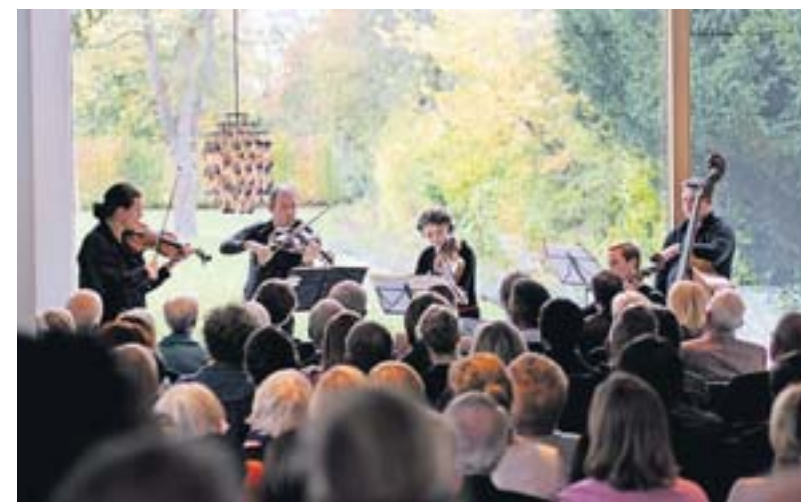
Konzert im Wohnzimmer – ein Konzept, das ankommt.